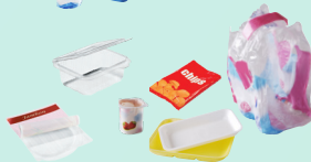
tous les autres emballages en plastique