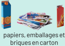
papiers, emballages et briques en carton