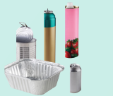
emballages en métal

À déposer en vrac , sans les laver, les emboîter ni les compacter.