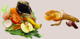
épluchures, coquilles d'oeufs