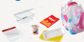
tous les autres emballages en plastique