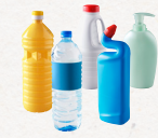
bouteilles et flacons en plastique