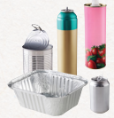
emballages en métal