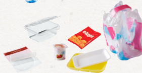
tous les autres emballages en plastique