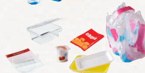
tous les autres emballages en plastique