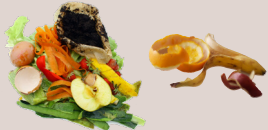
épluchures, coquilles d'oeufs