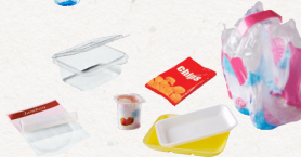
tous les autres emballages en plastique