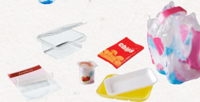
tous les autres emballages en plastique

À déposer en vrac , sans les laver, les emboîter ni les compacter.