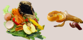
épluchures, coquilles d'oeufs